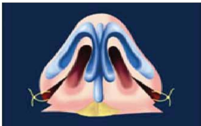
Figura 9. A sutura é realizada no sentido duplo, ou seja, da direita para a esquerda e da esquerda para a direita.