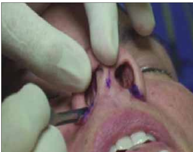
Figura 13. Passo 3.