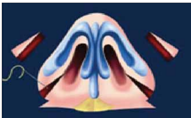
Figura 5. Ressecção da pele do véstibulo e do rebordo narinário acima do sulco nasolabial.