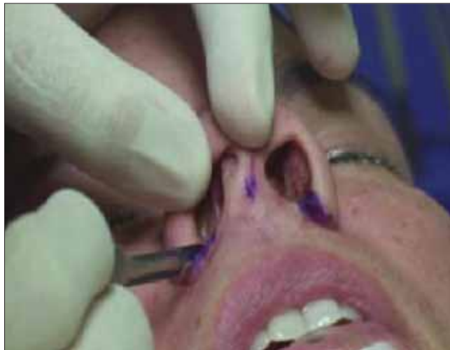
Figura 3. Técnica de Weir modificada.