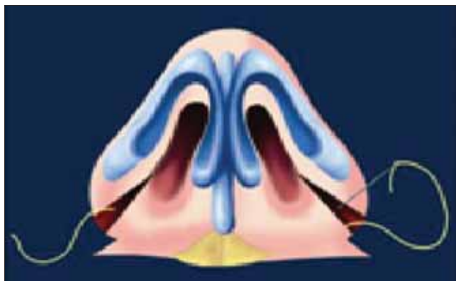
Figuras 7 e 8. Retorna de forma inversa, ou seja, do rebordo lateral para o rebordo medial.