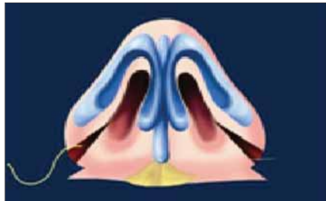
Figura 6. Com agulha reta e fio mononylon® 4-0 incolor, procede-se a introdução da agulha no rebordo lateral para o rebordo medial contralateral.