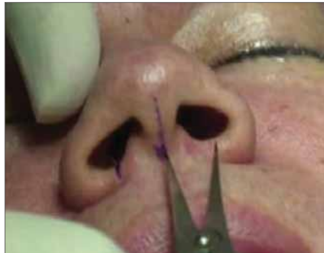
Figura 4. Marcação com compasso.