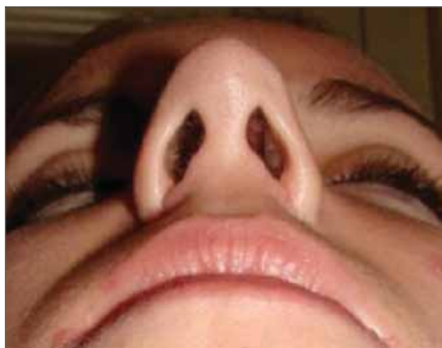
Figura 16. Pós operatório visão de base.