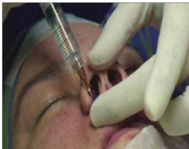
Figura 12. Passo 2.

Caso II - Paciente feminino, 17 anos, pele fina, pré e pós-operatório imediato (Figuras 17 e 18).