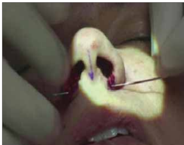
Figura 14. Passo 4.