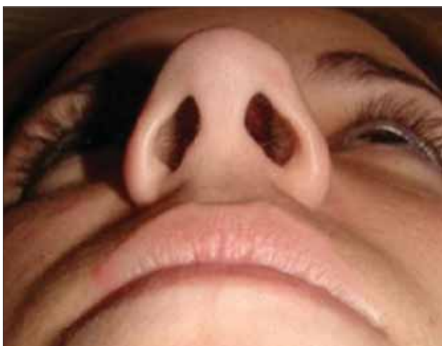
Figura 15. Pré operatório visão de base.