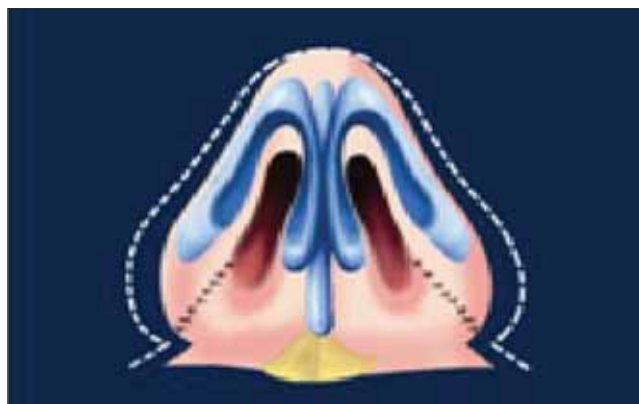
Figura 10. Por último, aproxima-se a pele com fio mononylon® 5.0.

Obs. A sequência é repetida na narina contralateral, como descrito por Gruber (3), 2009.