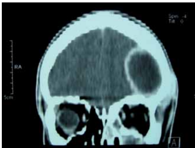
Figura 3. Tomografia computadorizada de crânio evidenciando abscesso intracraniano.