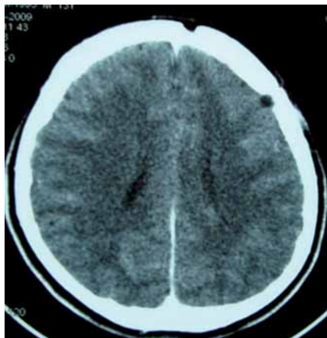
Figura 5. Tomografia computadorizada de crânio 30 dias após drenagem cirúrgica, sinais de craniotomia frontal esquerda.

O paciente apresentado neste relato de caso é um adolescente do sexo masculino o que converge com os dados da literatura. Estudos anteriores, porém, não chegaram a uma explicação científica sobre a prevalência no sexo masculino. Já com relação à faixa etária, a maior incidência de IVAS (infecções de vias aéreas superiores) e a presença de osso diploico com maior grau de vascularização nas paredes dos seios destes pacientes geram esta condição (9).