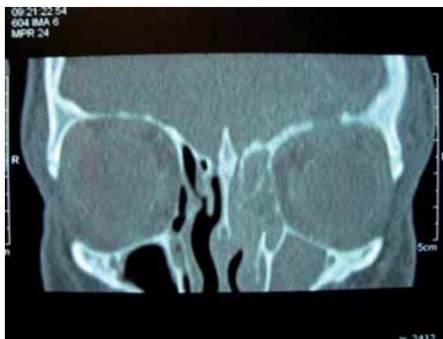
Figura 1. Tomografia computadorizada dos seios paranasais (corte coronal com janela para parte óssea) com áreas com densidade de partes moles preenchendo totalmente o seio maxilar esquerdo e células etmoidais à esquerda além de destruição do teto da órbita à esquerda.

Ao exame oftalmológico apresentava proptose discreta, distopia inferior, edema de pálpebra superior e sinais flogísticos em olho esquerdo. Acuidade visual normal bilateral. Foi realizada tomografia computadorizada (TC) de crânio