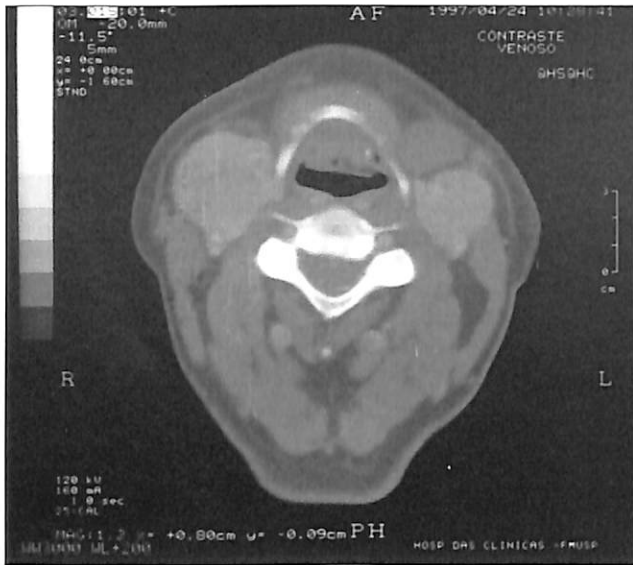
Figura 1: TC sem contraste, corte axial, mostrando tumorações na região de trigono carotídeo bilateralmente.